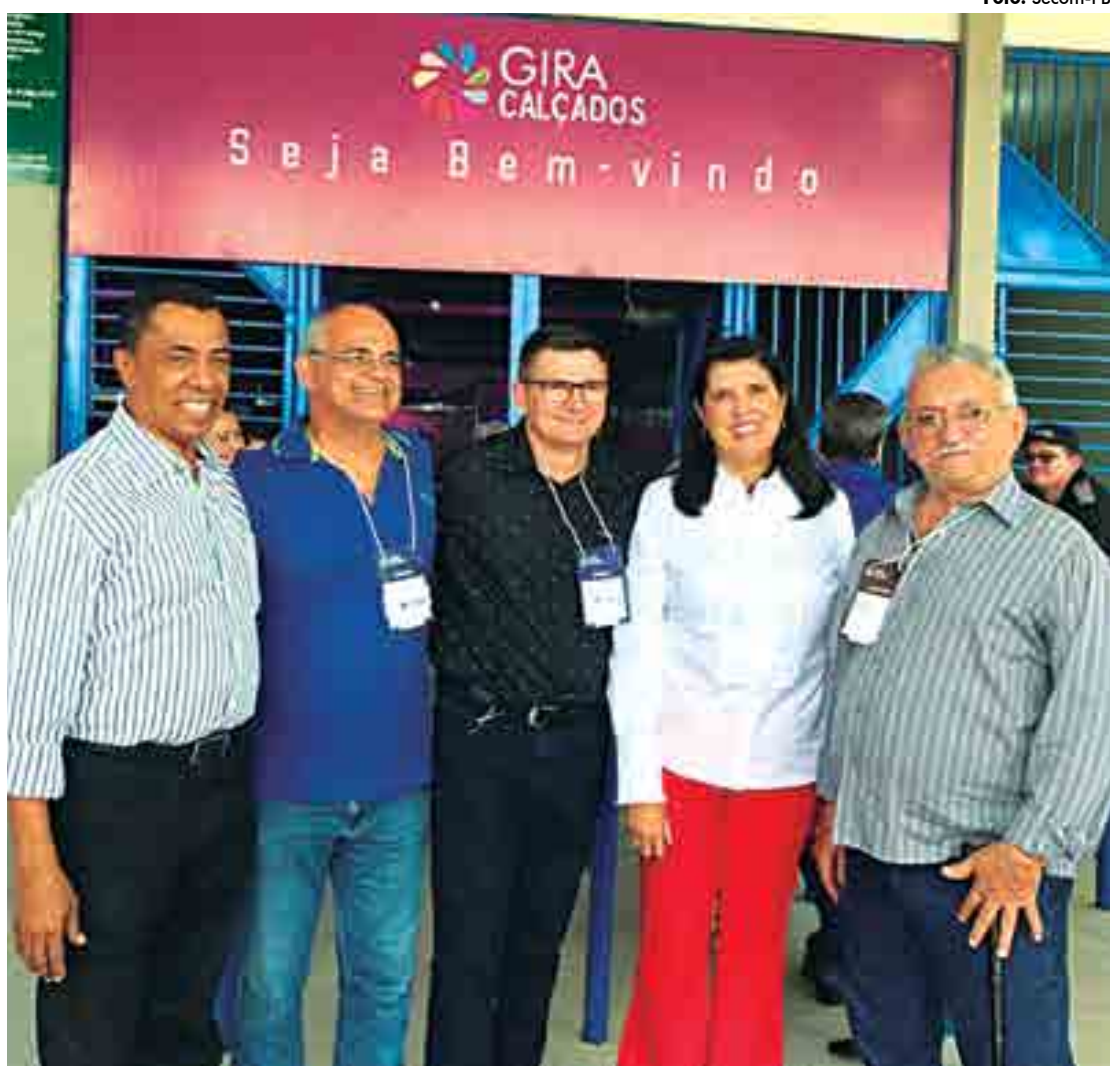
A vice-governadora Lígia Feliciano visitou a 7ª Gira Calçados, ontem, no Spazzio, na cidade de Campina Grande