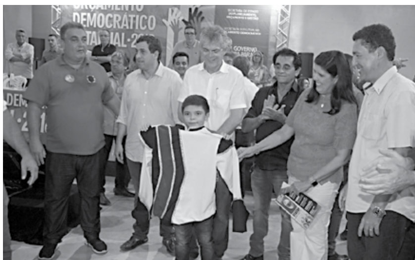
Foram entregues fardamentos e instrumentos para a banda marcial da Escola de São Bento

Durante a plenária, o governador assinou 84 contratos por meio do Empreender Paraíba, destinando R$ 517 mil a empreendedores e microempreendedores da região. Ricardo abriu a plenária falando sobre a importância do OD Estadual e da participação do povo nesse processo de construção da