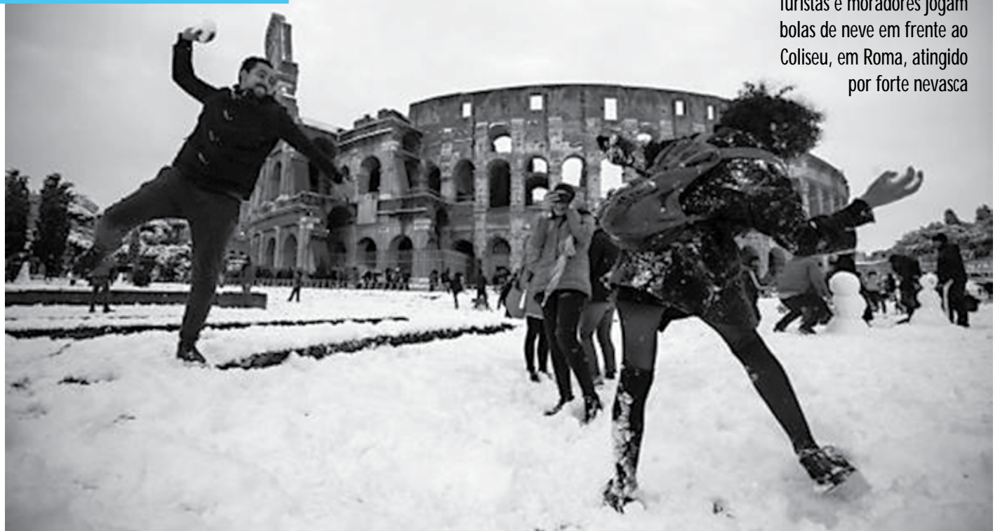
Turistas e moradores jogam bolas de neve em frente ao Coliseu, em Roma, atingido por forte nevasca