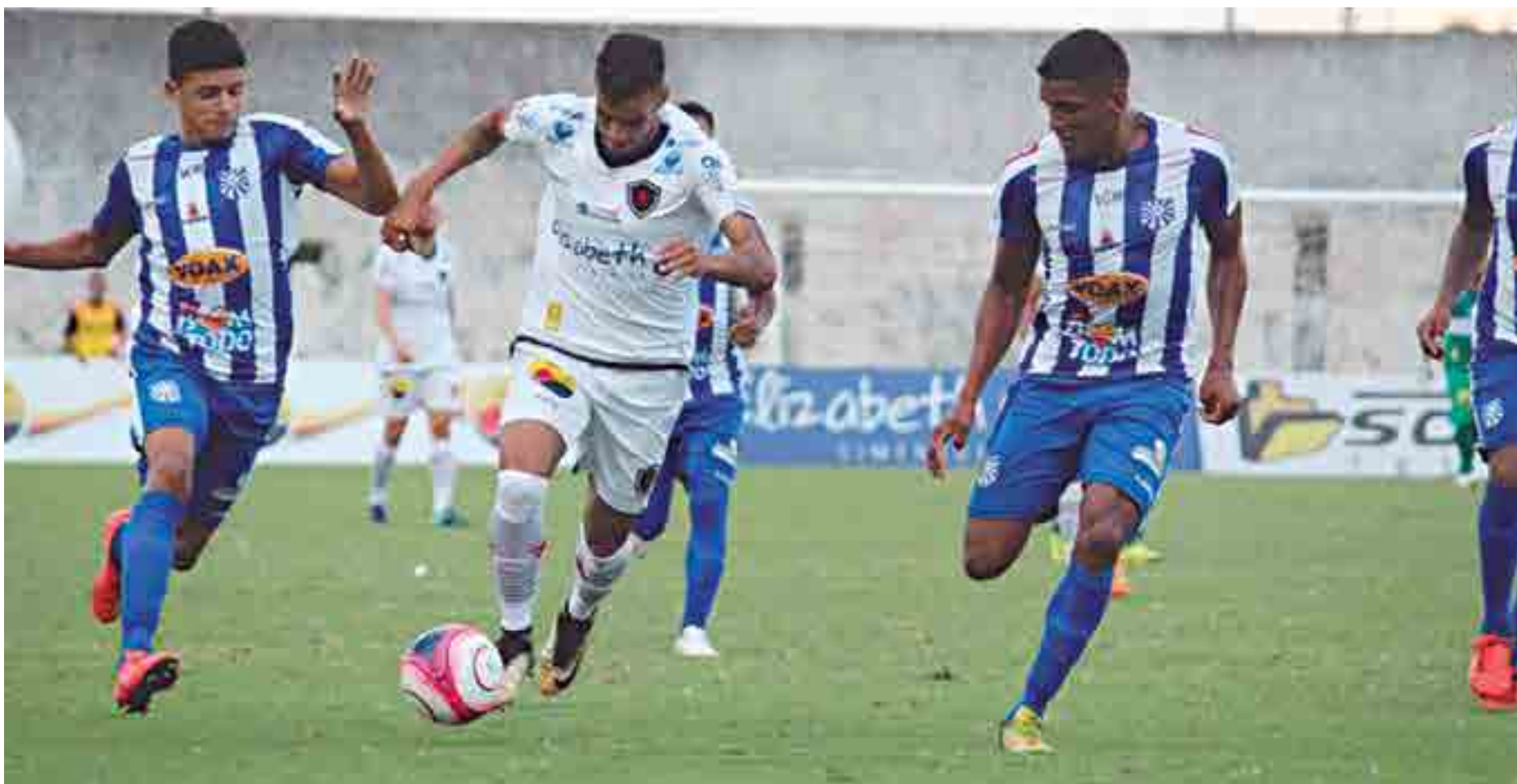
O Botafogo encontrou muitas dificuldades no primeiro tempo, mas na etapa final abriu a porteira e meteu cinco gols na Desportiva Guarabira pelo Estadual, no último domingo, no Almeidão

O pensamento agora na Maravilha do Contorno é vencer o Atlético e torcer para que o Campinense não vença o Treze no clássico do próximo domingo. Se isto acontecer, o Botafogo terminará na liderança do Grupo A e estará classificado de forma direta para as semifinais.