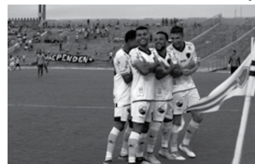
Botafogo paraibano está bem na estatística nacional