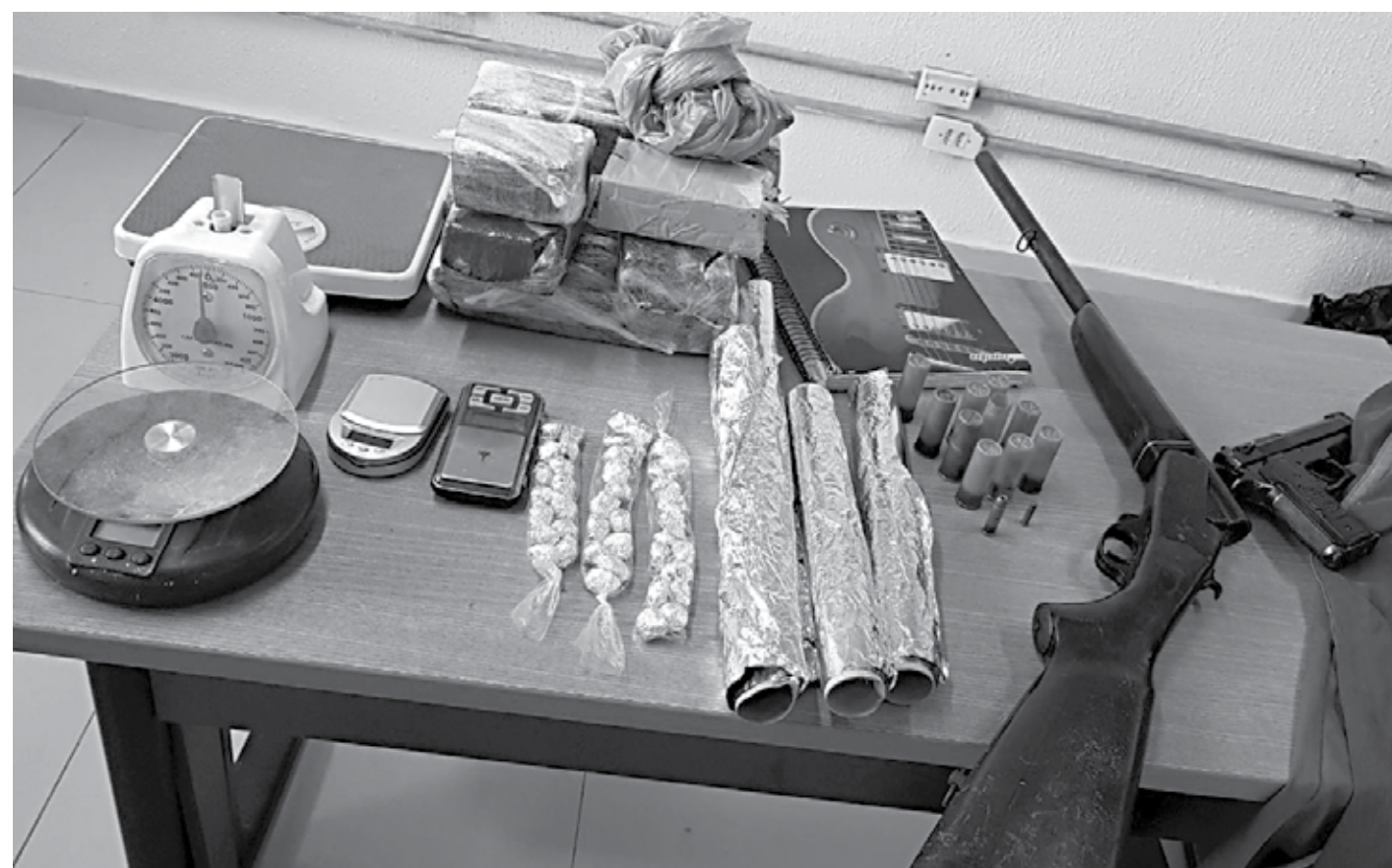
Na casa dele, os policiais apreenderam cinco quilos de maconha, quatro balanças de precisão, uma espingarda, um simulacro de pistola e equipamentos

Em seguida, os policiais solicitaram apoio do Canil do Bope, que, utilizando o cão 'Messi', conseguiu localizar outra parte dos entorpecentes escondida em uma sacola. Ao todo, foram 68 trouxas e quatro tabletes de maconha apreendidos, além de material para embrulho dos entorpecentes. O suspeito, que tem 33 anos, e as drogas, foram levados para a 6ª Delegacia Distrital.