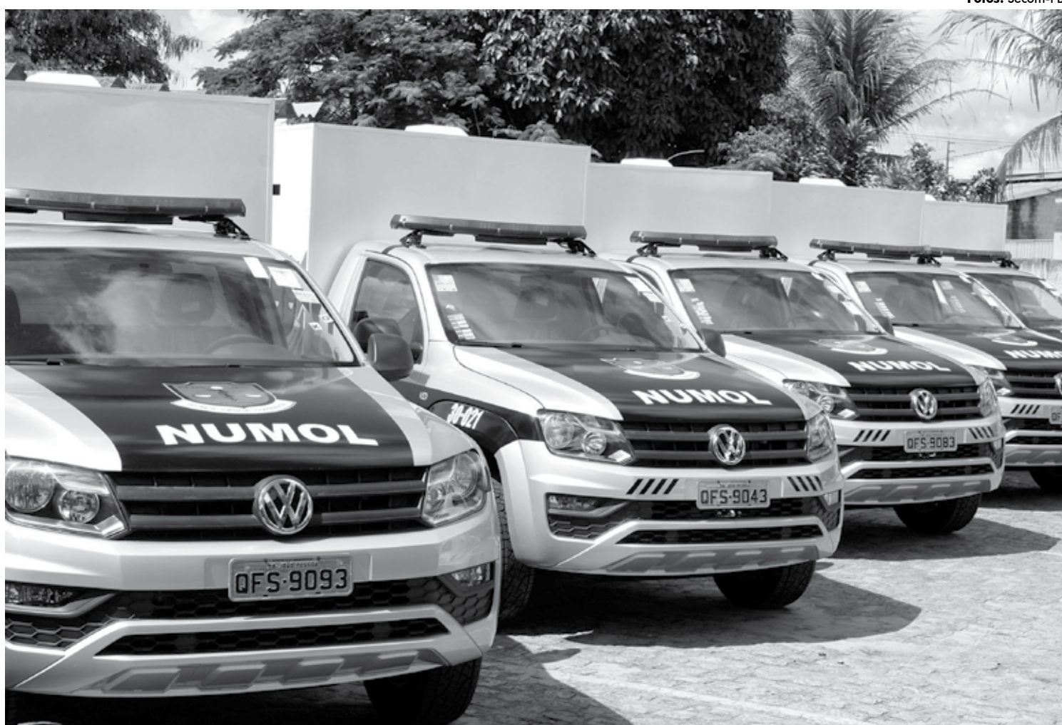
Os carros, que serão utilizados em local de morte violenta, fazem parte de um contrato de locação realizado pelo Departamento Estadual de Trânsito

Os veículos serão destinados para as três Regiões Integradas de Segurança Pública (Reisp), abrangendo todo o Estado