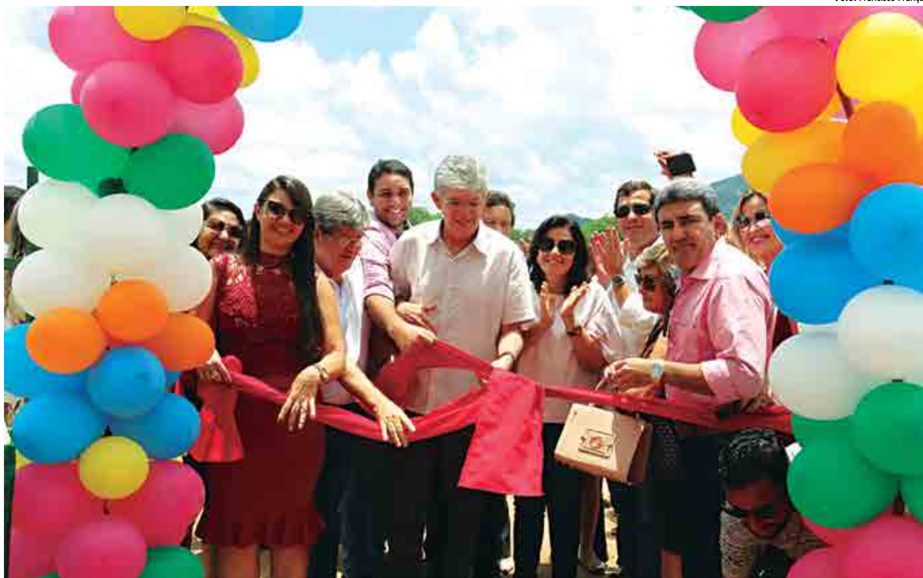
Governador Ricardo Coutinho inaugurou o Centro Municipal, que atende 80 crianças de 2 aos 5 anos, e defende parceria com as prefeituras para proporcionar melhorias na educação

De acordo com o secretário de Infraestrutura, Recursos Hídricos, Meio Ambiente, Ciência e Tecnologia, João Azevêdo, a educação