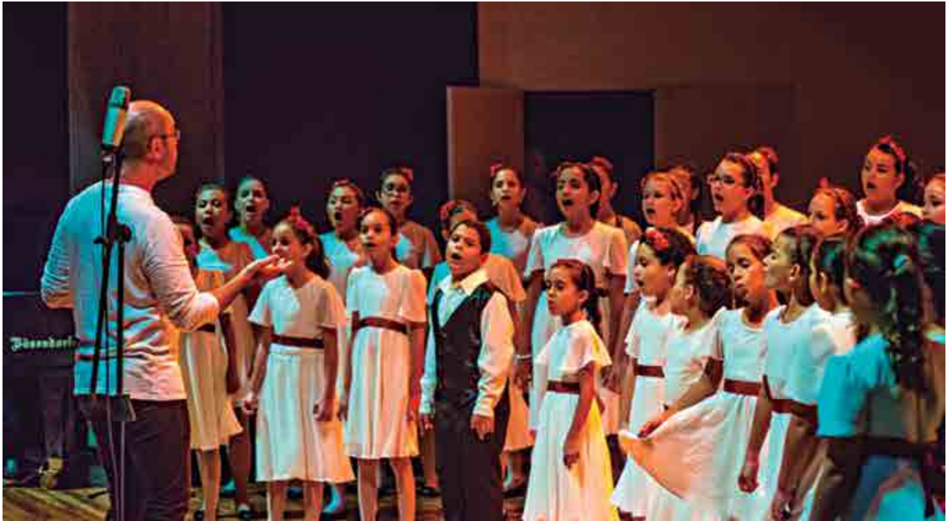
O Coro Infantil é administrado pelo Orquestra Sinfônica da Paraíba (OSPB) e os coristas participam durante todo o ano de concertos realizados pela Funesc e por diversos outros órgãos do Estado

O candidato será submetido a um teste de apti-