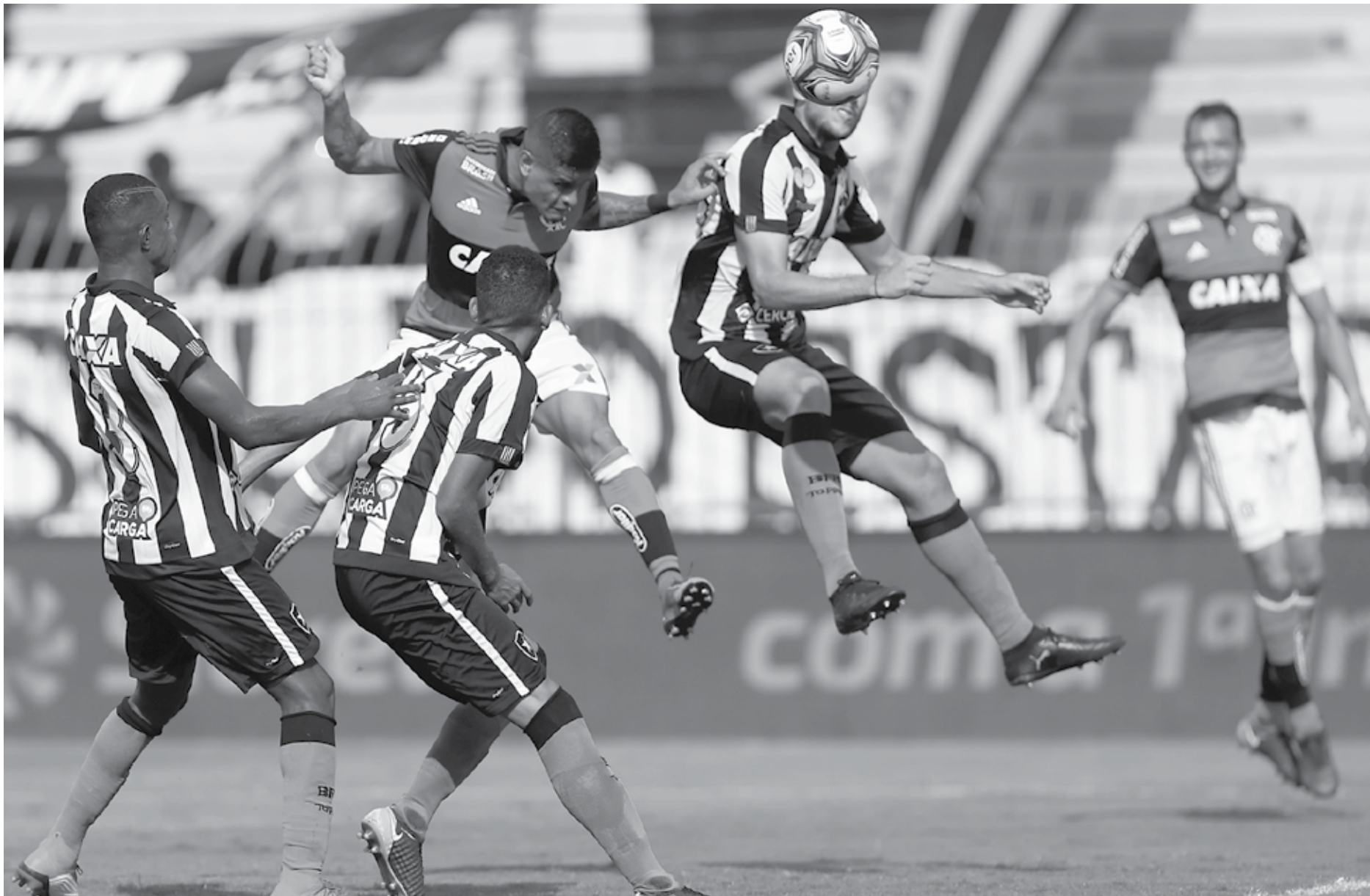
As duas equipes se encontraram nas semifinais da Taça Guanabara e o Flamengo levou a melhor ao vencer por 3 a 1. Agora o Botafogo tem a chance de dar o troco com o adversário focado na Libertadores