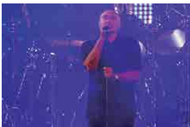
Britânico atraiu multidões nos shows de Rio de Janeiro e São Paulo

Não é à toa que Phil Collins é considerado uma lenda viva, com um trabalho admirado cada vez mais. Além de venderem mais de 100