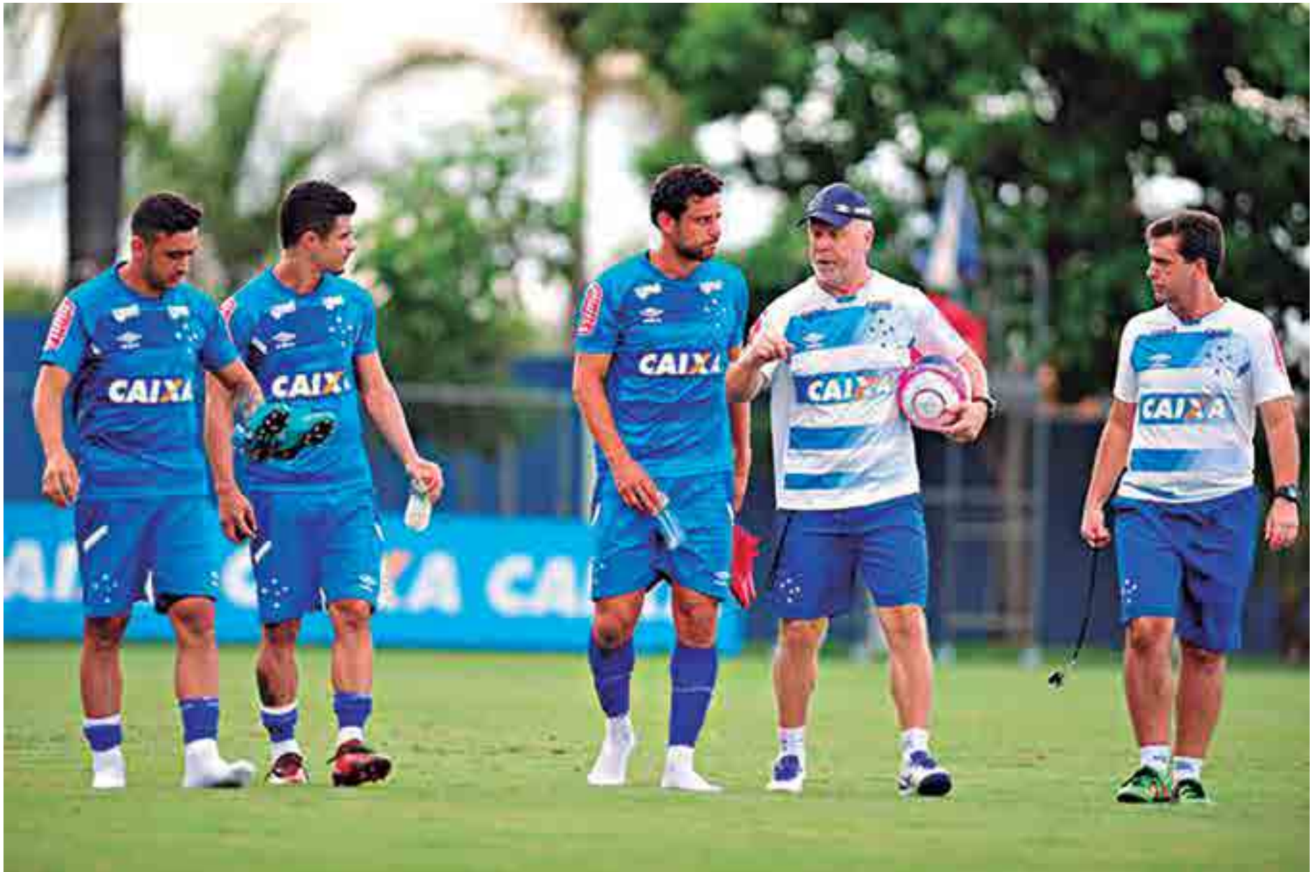
O técnico Mano Menezes conversa com os jogadores sobre a estreia do Cruzeiro na Taça Libertadores, que acontece nesta terça-feira na Argentina diante do Racing

Buscando o bicampeonato da Copa Libertadores, o Palmeiras estreia pela competição nesta quinta-feira, contra o Junior Barranquilla, às 21h30 (de Brasília), na Colômbia. Além do adversário da estreia, Boca Juniors e Alianza Lima são as outras duas equipes da chave.